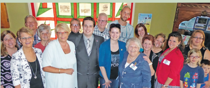
100e anniversaire, Sainte-Anne-du-Lac, en 2016 Programme de commémorations communautaires

Le gouvernement du Canada appuie l'animation et le rayonnement culturels dans la région. Ainsi, le fédéral est partenaire des projets de rénovation du Théâtre Le Patriote de Ste-Agathe et de relocalisation du Centre d'exposition de Mont-Laurier. Patrimoine canadien soutient le Festival des Arts de St-Sauveur; la Grande Traite des gosseux, conteux et patenteux de Nominique; le Festi-Jazz de Mont-Tremblant; la journée culturelle et multiculturelle de la MRC des Laurentides; le Festival 1001 visages de la caricature de Val-David et les festivités de la Fête du Canada (à La Macaza, Arundel et Mont-Tremblant). Patrimoine canadien soutient également la programmation du Théâtre du Marais de Val-Morin et de Muni-Spec Mont-Laurier, et offre un programme de commémorations communautaires, notamment pour les festivités entourant l'anniversaire d'une municipalité.