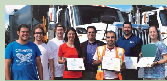
Régie Intermunicipale des Trois Lacs (RITL)