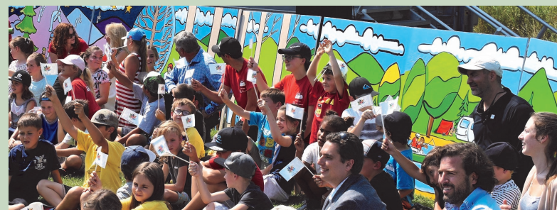
Murale réalisée par des jeunes; Mont-Tremblant Programme Canada 150