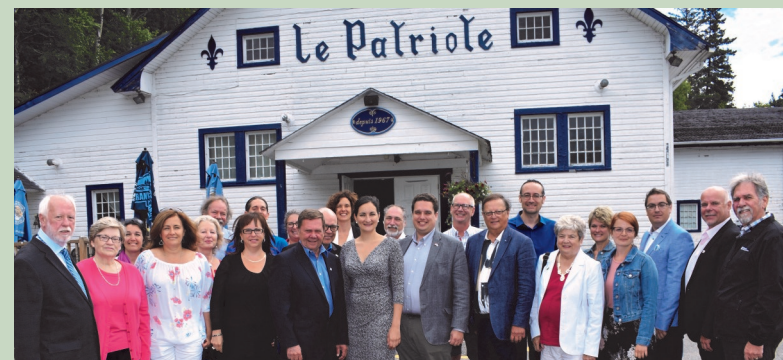
Théâtre Le Patriote; Sainte-Agathe-des-Monts Fonds des Petites Collectivités Canada-Québec