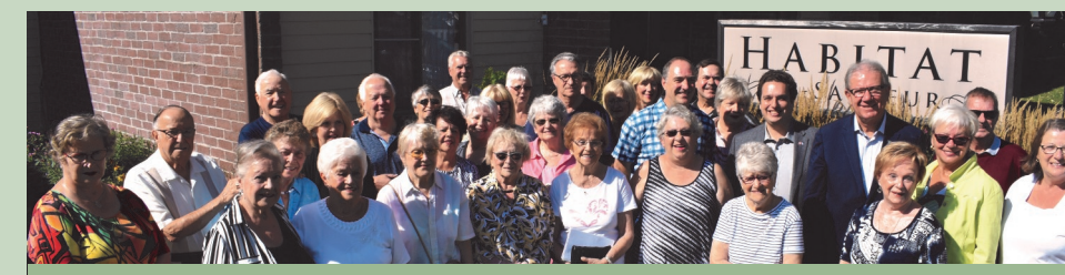
Habitat Saint-Sauveur: Réfection de la toiture, programme de la SCHL — automne 2017