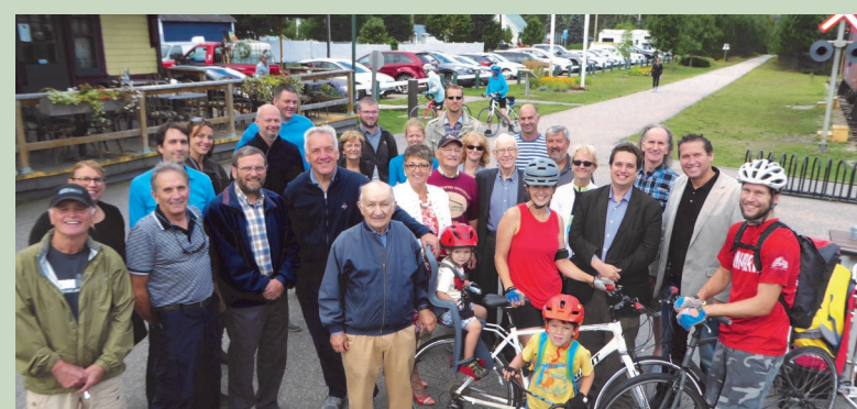
Parc linéaire Le P'tit Train du Nord Réfection de la piste PIC 150 — septembre 2017