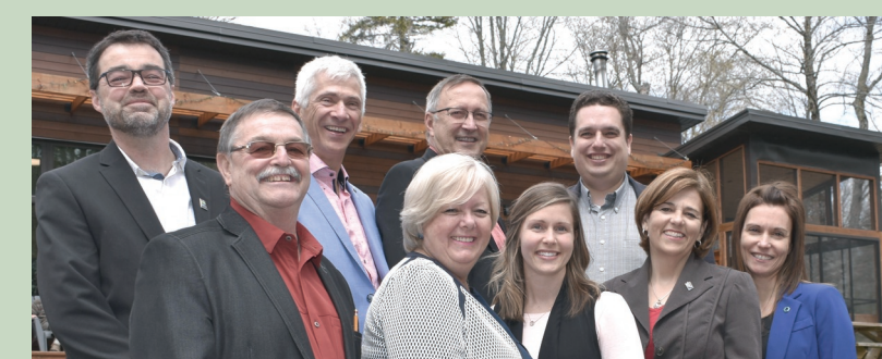
Parc de la Montagne du Diable, Ferme-Neuve Développement du pôle Windigo — mai 2019

Via Développement Économique Canada (DEC), et divers programmes fédéraux, le gouvernement du Canada appuie les entreprises et le développement économique et social dans notre région: