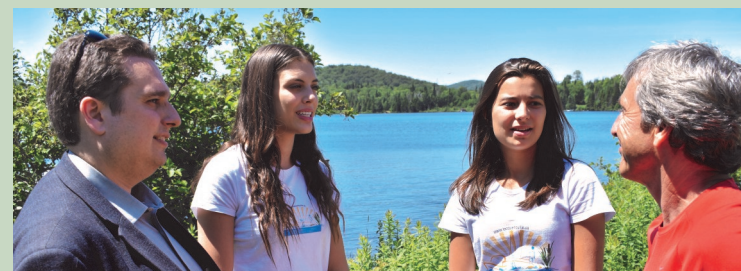
Association des propriétaires du Lac Quenouille (Sainte-Agathe-des-Monts, Val-des-Lacs et Lac-Supérieur)