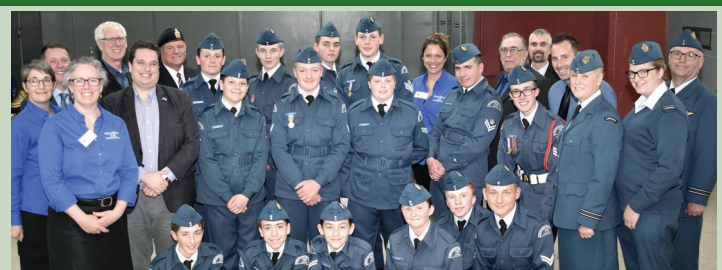
Cadets de l'air Mont-Tremblant — Escadron 716 Laurentien