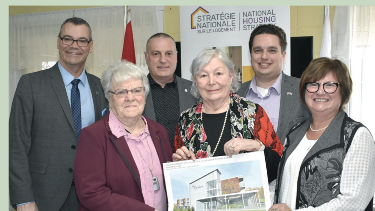
Projet Villa-Cartier; Rivière-Rouge Construction de logements sociaux SHQ et SCHL — mars 2019