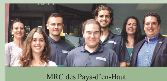
MRC des Pays-d'en-Haut Société plein air des Pays-d'en-Haut (SOPAIR)