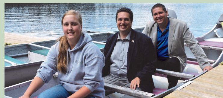
Saint-Faustin-Lac-Carré Parc Éco Tourisme Laurentides (CTEL) Bonification des aménagements; PIC 150 — août 2017