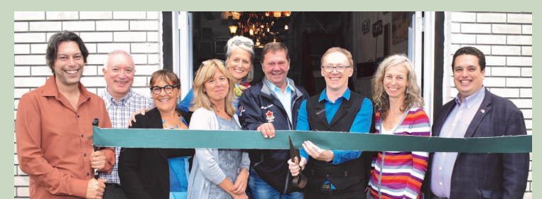
Inter Action Travail; Sainte-Agathe-des-Monts Programme Connexion Compétences — mai 2018