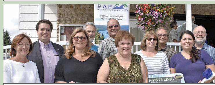
Regroupement des Associations de Protection des lacs et cours d'eau des Hautes-Laurentides (RAP-HL)