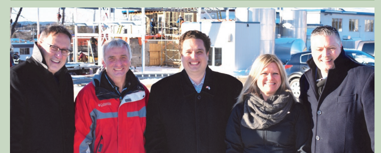
Laiterie des Trois Vallées; Mont-Laurier Programme d'amélioration de la productivité — janvier 2018