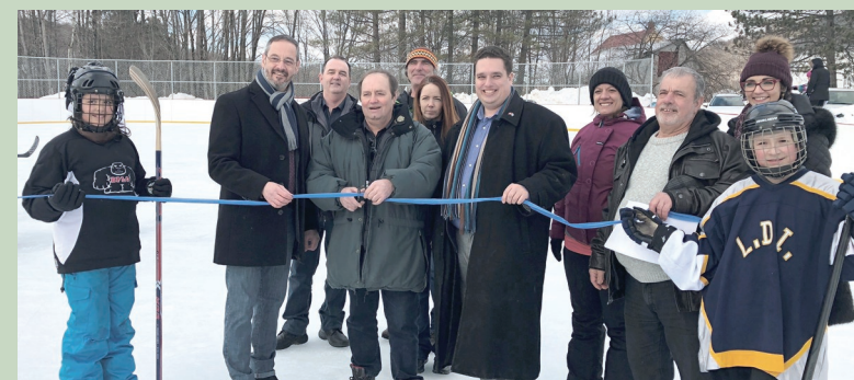
Saint-Aimé-du-Lac-des-Îles Patinoire extérieure multifonctionnelle Fonds des petites collectivités Canada-Québec — février 2018