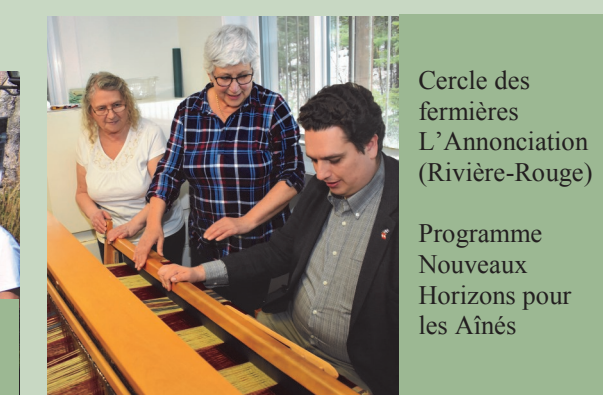
Cercle des fermières L'Annonciation (Rivière-Rouge)