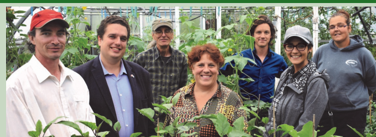
Jardins Cultiver pour nourrir (Fonds AgriEsprit) Table en sécurité alimentaire d'Antoine-Labelle

Nous sommes aussi partenaire de Synergie économique Laurentides , un organisme dont la dynamique équipe accompagne les entreprises dans la réduction des matières résiduelles et des gaz à effet de serre (GES).