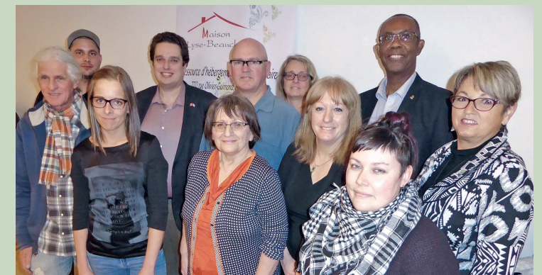
Maison Lyse-Beauchamp, Mont-Laurier et Ferme-Neuve Stratégie Partenariats Lutte contre l'itinérance — mars 2017