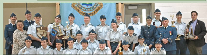
Cadets de l'air Mont-Laurier — Escadron 739 Vallée du Lièvre