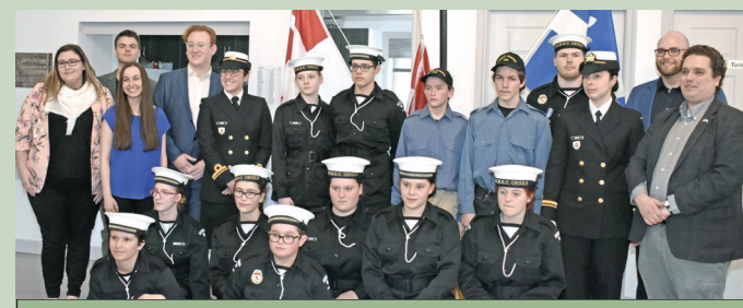
Cadets de la marine de Notre-Dame-du-Laus Escadron 312 Oriole

Laurentides—Labelle compte trois escadrons de cadets sur le territoire, soutenus par un programme fédéral qui contribue à l'épanouissement des jeunes et à leur implication, à travers le Canada. Merci aux officiers, parents et bénévoles dévoués! Bravo aux cadets d'hier et d'aujourd'hui!