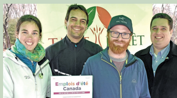
Table Forêt Laurentides

Le programme Emplois d'été Canada favorise d'enrichissantes expériences de travail chez les jeunes de 15 à 30 ans, grâce à des employeurs impliqués. Dans Laurentides—Labelle, trois fois plus d'emplois jeunesse ont été soutenus en 2019 qu'en 2015. Cet été, ce sont 236 emplois issus de 210 projets qui sont appuyés par le gouvernement du Canada ( photos ci-bas: projets 2019 d'EEC ). En 4 ans, 2,32 millions $ ont été approuvés, en vue de soutenir la création de plus de 850 emplois estivaux dans les 43 municipalités du territoire, pour les organismes à but non-lucratif, les organismes publics et les entreprises privées. Sur le terrain, on constate l'appréciation pour ce programme et ses effets positifs.