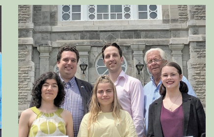
Festival des Arts Saint-Sauveur Chambre de commerce et de tourisme Vallée St-Sauveur Musée du ski des Laurentides