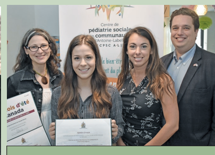
Centre de pédiatrie sociale en communauté d'Antoine-Labelle