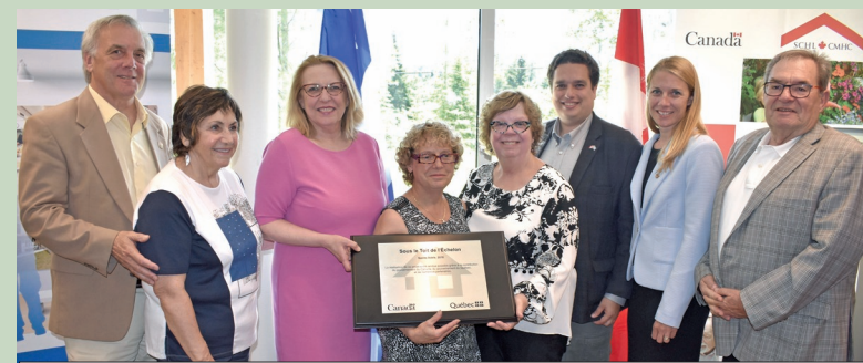
Sous le toit de l'Échelon; Sainte-Adèle Logements — ressource alternative en santé mentale Inauguration — juin 2018