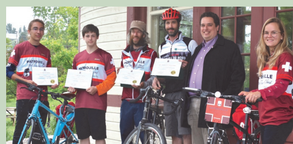
Parc linéaire Le P'tit Train du Nord