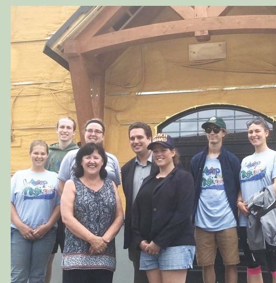
Sainte-Anne-des-Lacs Rénovation du centre communautaire PIC 150 — août 2017