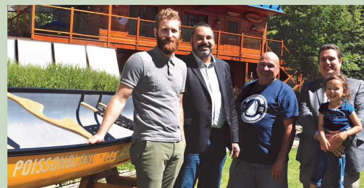
Notre-Dame-du-Laus Parc régional du Poisson Blanc Amélioration des installations; PIC 150 — août 2017