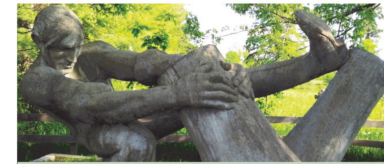
«Le Défricheur», sculpture de l'artiste Roger Langevin À Kiamika, devant l'entrée des ponts couverts jumeaux

C'est grâce à Benjamin Sulte et son livre de 1899 intitulé Histoire de Jos Montferrand, que nous pouvons lire sur lui. Le plus célèbre récit à son sujet est lorsque Montferrand s'est opposé à 150 immigrants irlandais «Shiners», qui voulaient monopoliser le commerce du bois d'œuvre dans la région de la Gatineau et de l'Outaouais. Ils ont attaqué Montferrand sur le pont Union, suspendu au-dessus des chutes de la Chaudière de la rivière des Outaouais. Le pont descendait en son centre, et sa largeur permettait tout juste à deux personnes de se rencontrer. Les adversaires devaient affronter Montferrand un ou deux à la fois. Beaucoup d'Irlandais ont été projetés dans les eaux tumultueuses, et de nombreux autres ont fui.