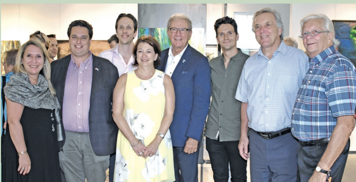
Festival des Arts de Saint-Sauveur Programme de soutien aux festivals