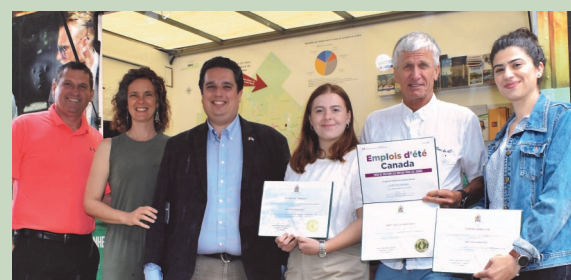
MRC des Laurentides — Caravane de l'emploi