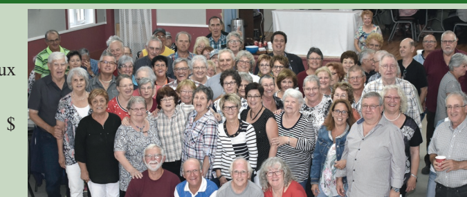
Club d'âge d'or de Val-Barrette (Lac-des-Écorces) Programme Nouveaux Horizons pour les Aînés